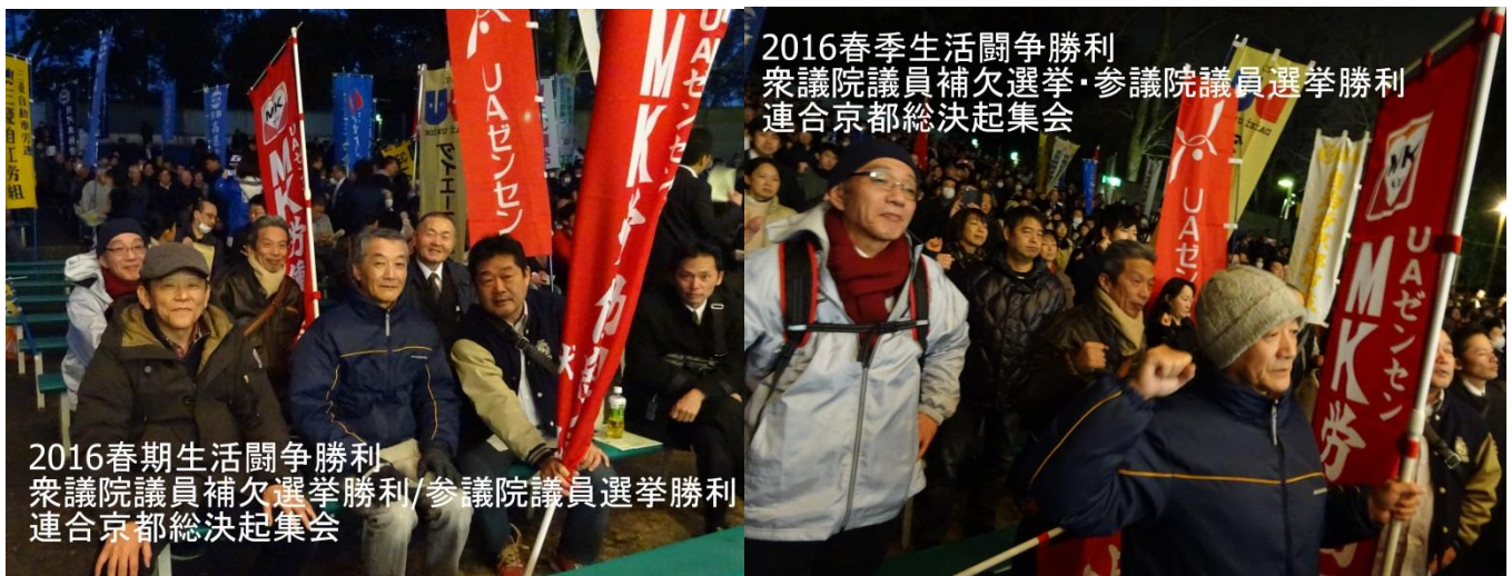
2016春季生活闘争勝利 衆議院議員補欠選挙・参議院議員選挙勝利 連合京都総決起集会

われわれは要求趣旨に沿った回答を引き出すことに全力を挙げ、その成果を社会的に波及させていく。